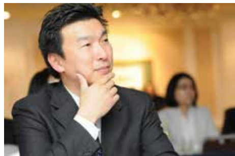
【講師】実践するドラッカー/実践ナビゲーター

シリーズ20万部というビジネス書としては異例のベストセラーとなった『実践するドラッカー』シリーズ。ドラッカーの数々の教えの中からテーマを絞ってまとめられた良書です。本講座は、経営層はもちろん、組織の核となるリーダークラスの意識と行動に焦点をあて、セルフマネジメントとチームへのかかわり方について、ドラッカーの教えから